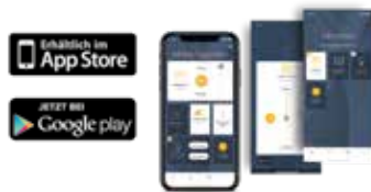
Smart-Home-App TaHoma® App