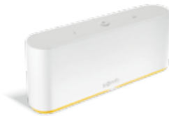
Smart-Home-Zentrale TaHoma® Switch

Wenn Sie sich für ein voll ausgerüstetes Smart Home entscheiden, vernetzt die Smart-Home-Zentrale TaHoma® Switch von Somfy Ihre bereits installierten Funk-Anwendungen. Damit können Sie Ihren Innen- und Außensonnenschutz sowie Ihre Terrassenprodukte per Smartphone automatisch steuern und programmieren.